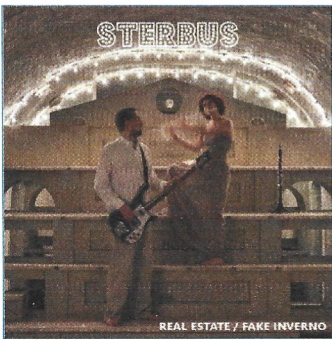
Sterbus REAL ESTATE / FAKE INVERNO Million Watt Records