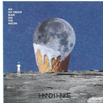
Handshake AN ICE CREAM MAN ON THE MOON Urtovox Records