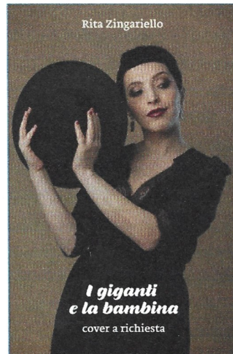
Rita Zingariello I GIGANTI E LA BAMBINA - COVER A RICHIESTA autoprodotta

Quartetto toscano attivo da circa cinque anni, gli Handshake propongono un rock con venature psichedeliche cantato in inglese. Dopo un Extended play un pochino acerbo, il gruppo sembra aver trovato una sua fisionomia artistica delineata e licenzia un album maturo, acido, con la giusta dose di ruvidezza che dona freschezza al tutto. Da segnalare la collaborazione con i Nothing for Breakfast nel singolo The Importance Of Being A Penguin .